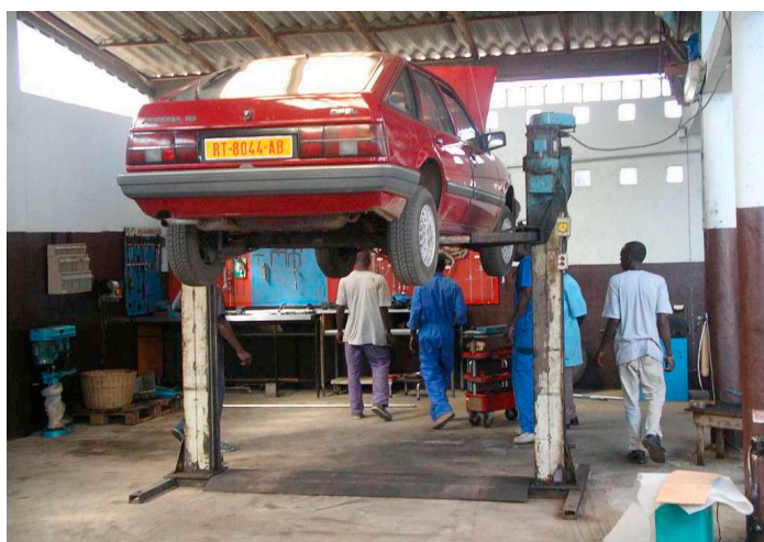
Die automechanische Lehrlingswerkstatt

Lang anhaltend war sie vor allem für die jungen Lehrlinge der Autowerkstatt, die dank dem Verein eine Ausbildung abschliessen konnten und nun in der Lage sind, aus eigener Kraft den Lebensunterhalt zu