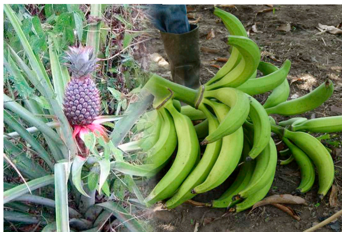
Produkte aus unserer Farm

Auch für die Jungbauern, die als Nutzniesser des zur Verfügung gestellten Farmlandes nahe bei Kpalimé auf eigenen Gewinn wirtschaften können, bot sich eine einzigartige Chance zur Selbstständigkeit und Autonomie, die sie in die Lage setzt, sich eine Lebensgrundlage erarbeiten zu können. Sie werden zudem