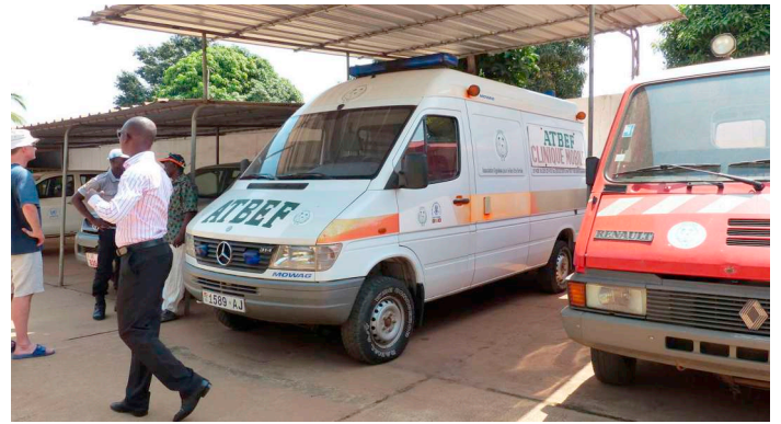
Ambulanzwagen aus Schaffhausen dient als Clinique mobile