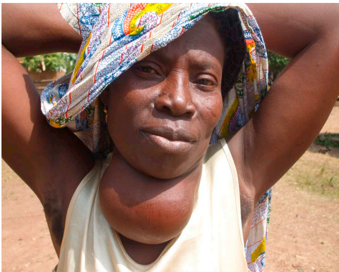
Typische Situation einer Patientin, die sich wegen Mangel an Ressourcen die Behandlung nicht leisten kann.

quent von der WHO durchgeführt oder unterstützt. Benötigt aber jemand medizinische Hilfe, dann muss er zunächst einmal bezahlen. Es gibt kaum Privatpraxen mit Allgemeinpraktikern wie bei uns. Es gibt einige Centres de Santé, die schlecht ausgerüstet und meist ohne Medikamente eine ganz einfache Grundversorgung anbieten, die man je nach Finanzkraft von einem Arzt oder aber von einer Krankenschwester in Anspruch nehmen kann. Sind Medikamente notwendig, muss man diese zuerst selber oder durch Angehörige in einer Apotheke auftreiben und kaufen. Ebenso Nahtmaterial für eine Wundversorgung oder Infusionen, z.B. für eine intravenöse Malariatherapie. Von labormässiger oder radiologischer Diagnostik kann man nur träumen. Dafür muss man ein Spital aufsuchen, wo man aber ebenfalls zuerst Bares sehen will, bevor ein Finger gerührt wird. Wird zum Beispiel eine junge Frau notfallmässig wegen Geburtsstillstand ins Spital gebracht, so liegt es an den Angehörigen, die entsprechenden Materialien, wie sterile Operationshandschuhe, Nahtmaterial und Infusionen für den Kaiserschnitt in der Apotheke oder in Form von Kits bei Angestellten des Operationstraktes, die so