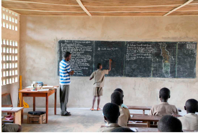
Unterricht im neuen Schulgebäude

viduelle Vorteile, wie den Lehrlingen. Aber es hebt die Qualität und Quantität des Unterrichts für viele Schüler während Jahren und stellt insgesamt eine Investition in eines der wichtigsten Güter eines Landes dar: nämlich die Schulbildung der Jugend. Das Kapital einer Gesellschaft überall auf der Welt liegt in der Ausbildung der Köpfe und – was noch besser wäre, wenn es auch dazugehörte – der Herzen.