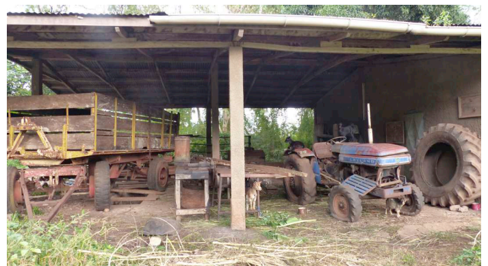
Das früher vorbildliche Projekt bietet ein Bild des Jammers