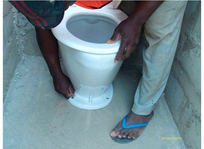
WC-Installation für die Schule

Ebenfalls gut voran kommt der Bau der Toilettenanlage, die von der Firma Preisig AG finanziert wird. Wie wir in den Togo News 2011 bereits ausführten, gehört zu einer durchdachten und praktisch sinnvollen Entwicklungshilfe die Berücksichtigung mehrerer Faktoren, wie sie ja bei uns ebenso selbstverständlich sind: zum Beispiel WC-Anlagen für die Schüler. Ohne diese verrichten die Schüler ihre Geschäfte einfach in den Büschen in der Umgebung der Schule, was aus