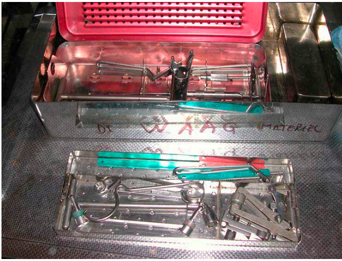
Mangelhafte Ausrüstung im Universitätsspital

quent von der WHO durchgeführt oder unterstützt. Benötigt aber jemand medizinische Hilfe, dann muss er zunächst einmal bezahlen. Es gibt kaum Privatpraxen mit Allgemeinpraktikern wie bei uns. Es gibt einige Centres de Santé, die schlecht ausgerüstet und meist ohne Medikamente eine ganz einfache Grundversorgung anbieten, die man je nach Finanzkraft von einem Arzt oder aber von einer Krankenschwester in Anspruch nehmen kann. Sind Medikamente notwendig, muss man diese zuerst selber oder durch Angehörige in einer Apotheke auftreiben und kaufen. Ebenso Nahtmaterial für eine Wundversorgung oder Infusionen, z.B. für eine intravenöse Malariatherapie. Von labormässiger oder radiologischer Diagnostik kann man nur träumen. Dafür muss man ein Spital aufsuchen, wo man aber ebenfalls zuerst Bares sehen will, bevor ein Finger gerührt wird. Wird zum Beispiel eine junge Frau notfallmässig wegen Geburtsstillstand ins Spital gebracht, so liegt es an den Angehörigen, die entsprechenden Materialien, wie sterile Operationshandschuhe, Nahtmaterial und Infusionen für den Kaiserschnitt in der Apotheke oder in Form von Kits bei Angestellten des Operationstraktes, die so