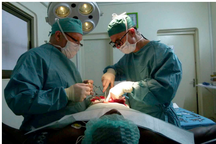
Leistenbruchoperation mit gespendeten Netzen und OP-Material

Bedarf beim einen oder anderen Team mithelfen konnte. Für die Anästhesie wurden uns je nach Bedarf ein Anästhesieteam zur Verfügung gestellt. Charles musste aber ebenfalls viele Male mithelfen, da die Anästhesisten nicht immer abkömmlich waren, weil sie noch in der Universitätsklinik tätig sind, denn wegen der schlechten Lohnbedingungen sind viele Ärzte gezwungen, an zwei Orten zu arbeiten.