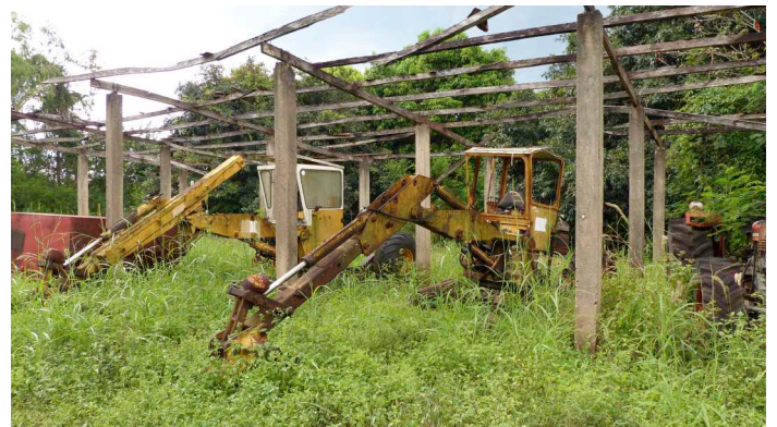
Verrostete Landmaschinen im verlassenen CFAE