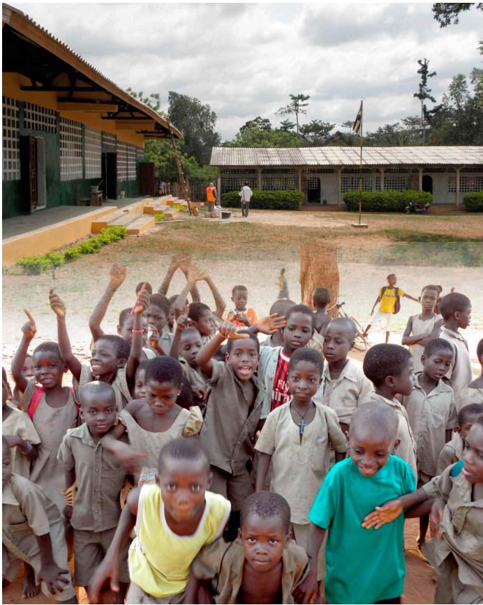
Freude in Lovikopé über das neue Schulgebäude

bus einzubauen und das Gebäude zu streichen. Es wird in wenigen Wochen bezugsbereit sein. Es ist eine grosse Freude zu sehen, wie aus der Weihnachtsaktion von Radio Munot vor zwei Jahren nun ein wirkliches Schulgebäude entstanden ist. Das wirklich Gute daran ist aber die Baugeschichte, denn es handelt sich nicht einfach um eine milde Gabe aus der Schweiz, die diesem Dorf fix und fertig hingebaut wurde. Das wäre ein ganz falscher Ansatz gewesen und so etwas hätten wir nie unterstützt. Nein, das ganze Dorf half beim Bau der Schule mit. Die Backsteine für die Mauern wurden selber hergestellt. Das Holz für die Dachkonstruktion kam aus der Umgebung und wurde lokal verarbeitet und das Dach war – zu einiger Enttäuschung der Zimmerleute, die eigens aus der Schweiz dorthin reisten, um bei Aufbau zu helfen – schon fast fertiggestellt als sie ankamen. Auch die Schulbänke und Pulte wurden vom lokalen Schreiner angefertigt und die Zwischendecke aus Palmmatten wurde in traditioneller Machart mit erneuerbaren Materialien, nämlich Palmblättern, hergestellt. So entstand ein Gemeinschaftsprojekt, das in der Bevölkerung verwurzelt ist und an dem sie zu einem Grossteil selber Hand anlegten. Eine solche Hilfe ist denn auch keine Gabe, die – mit den Worten Karl Rohrbachs – „von oben herab“ wirkt und den Empfänger entwürdigt, sondern ein Akt mitmenschlichen Wohlwollens, der Freude auf beiden Seiten bereitet. Und darum sollte es in unserem kurzen Dasein letztlich gehen.